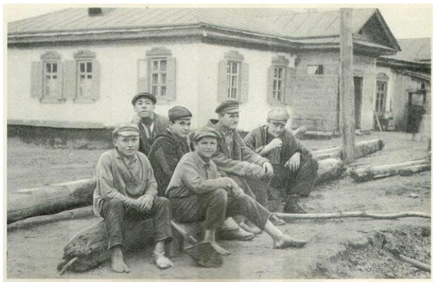
Группа воспитанников колонии им. М. Горького. 1925 год.

И у худого учителя в гимнастерке с высоким воротом (всю жизнь скрывал следы мучивших его в детстве карбункулов) случилось что-то вроде истерики. Сам себя не помня, он закричал, что больше не намерен это терпеть и что если им что-то не нравится, они все могут убираться из колонии прямо сейчас. А потом влепил здоровенному малолетнему преступнику неожиданно мощную оплеуху. Потом вторую, которая уронила колониста на пол и отбросила к печке. Он встал, потирая щеку, удивленный и перепуганный. В близоруких очках Макаренко пылали пожары праведного гнева. Колонист примирительно улыбнулся, махнул рукой корешам, и они пошли во двор — убирать снег.